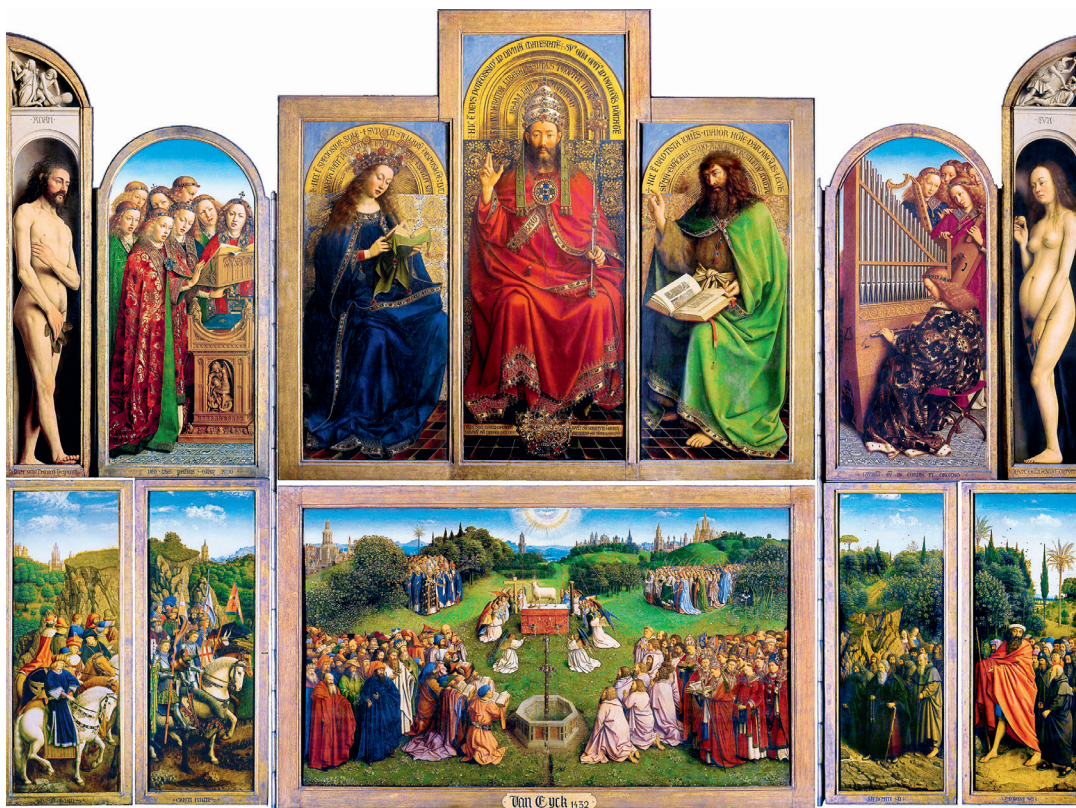
La adoración del Cordero Místico (Van Eyck, 1432).