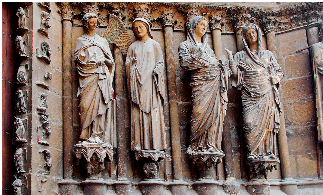
Anunciación (grupo escultórico de la izquierda) y Visitación (grupo escultórico de la derecha) en la catedral de Reims, (Francia).

5. Observa las siguientes imágenes y describe las características de la escultura y la pintura góticas: [B3: 29]