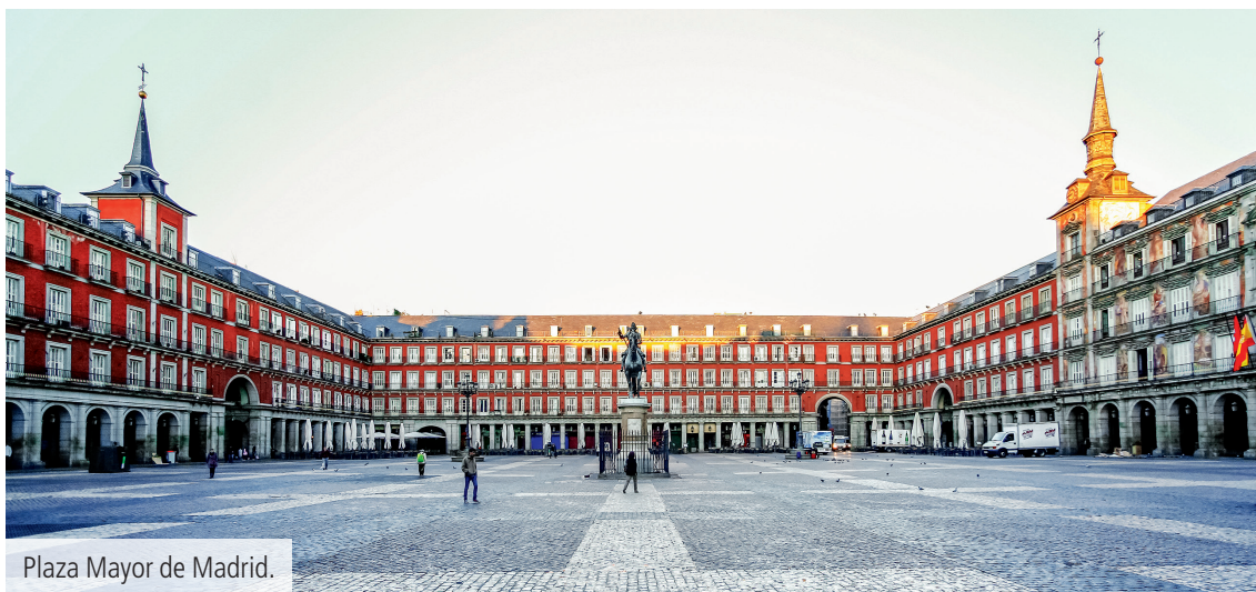
Plaza Mayor de Madrid.