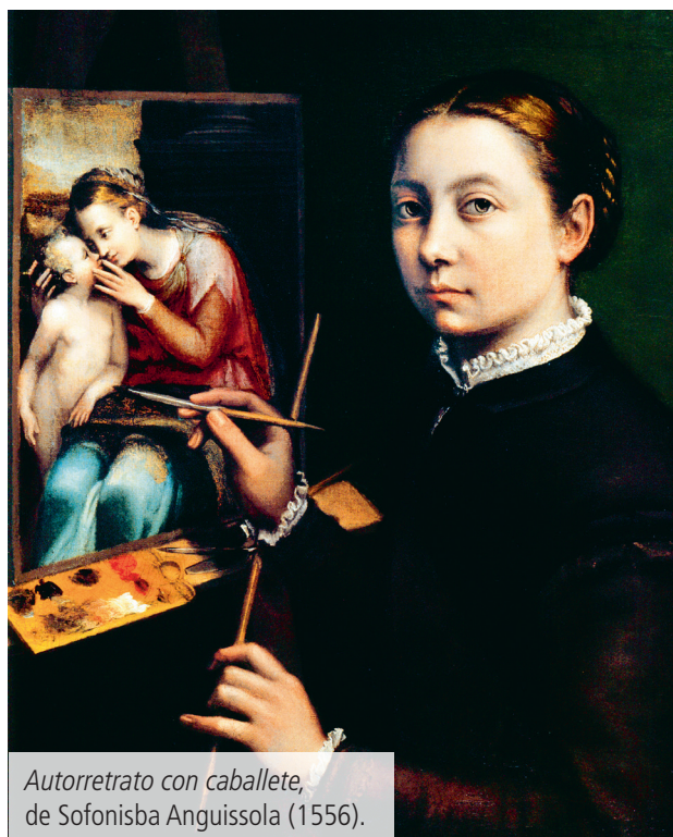
Autorretrato con caballete , de Sofonisba Anguissola (1556).