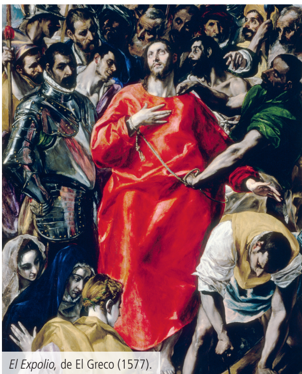
El Expolio , de El Greco (1577).

En escultura se siguió una temática religiosa y realista , obra representativa es El entierro de Cristo , de Juan de Juni (1541-1545). En pintura el autor más importante fue El Greco . La mayoría de sus obras fueron religiosas . También destacó la pintora Sofonisba Anguissola.