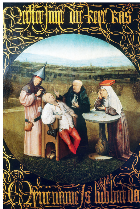
La extracción de la locura, de El Bosco (finales del siglo XV).