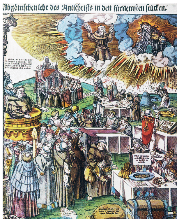
Contraste entre la cristiandad protestante y la católica, propaganda de Lutero.