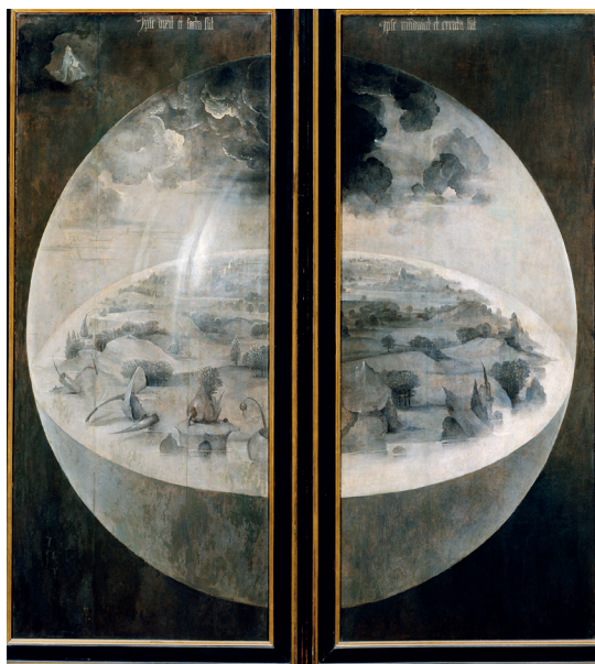
«La creación del mundo», tablas exteriores del Jardín de las delicias , de El Bosco (entre 1490 y 1510).