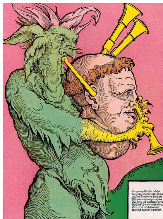
Caricatura de Lutero (siglo XVI).