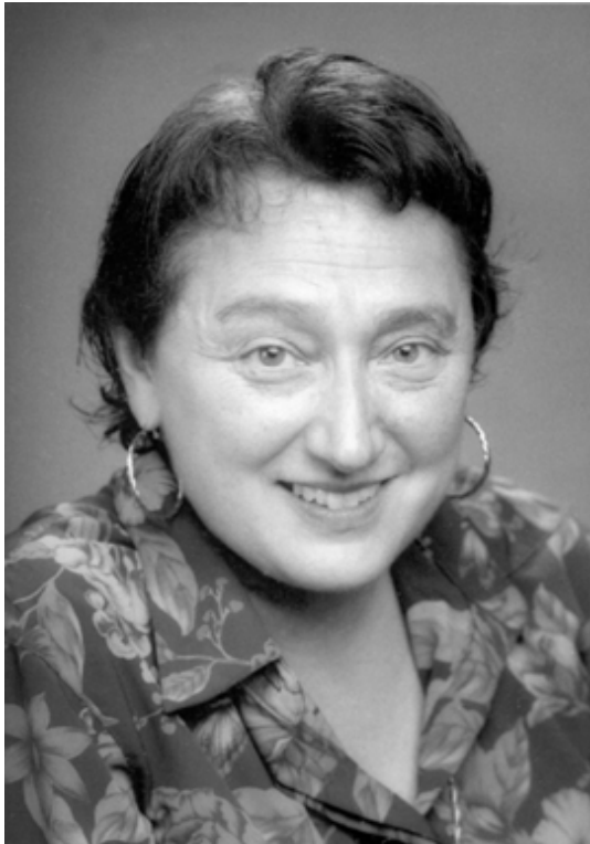
Lynn Margullis (1938).